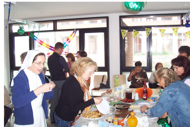
Si è costituito il gruppo terza età "Tesori dell'esperienza": si trovano ogni mercoledì alternando formazione festa e gioco.

Se il terreno è buono diventerà pianta. Con affetto don Beppe Trucco Tuo Parroco