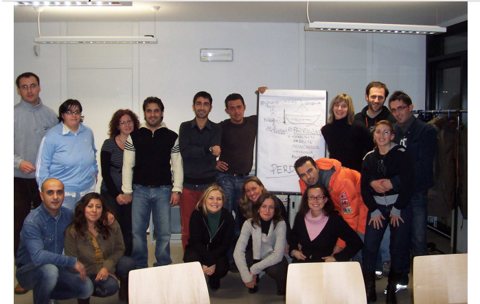
Giovani coppie al percorso per il matrimonio cristiano

anche via internet con posta elettronica e magari con qualche assemblea parrocchiale.